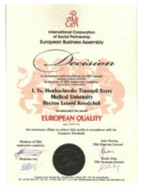
На міжнародній конференції «EuroEducation-2008» ТДМУ вручено нагороду «Європейська якість» (диплом, медаль, статуетка)

ства та грації. Довкола медальйона є напис-девиз «Labores Patriunt Honores» (лат.) – «Праця дає плоди». Повний комплект нагороди: медаль, статуетка та диплом.