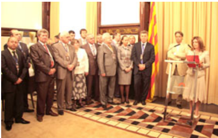
На прийомі у президента парламенту Каталонії

І ще. У нинішньому світі життєво необхідні гнучкість мислення і здібність до адаптації. Нові професії народжуються й вмирають, як метелики-одноднівки. Потрібна спеціальна чуттєвість до змін, щоб вчасно скорегувати свій шлях.