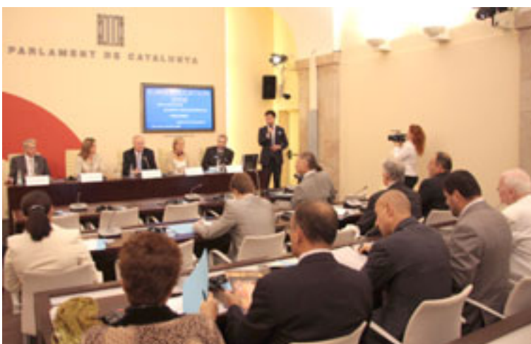
Під час роботи конференції