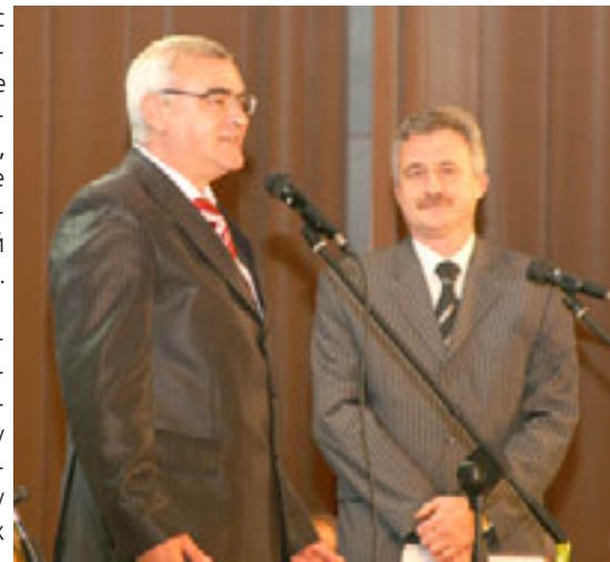
Заступник міського голови Тернополя Олег МАРУШІЙ, начальник міського управління охорони здоров'я Василь БЛІХАР

Учасників свята прийшли привітати заступник міського голови Тернополя Олег Марушій, начальник міського управління