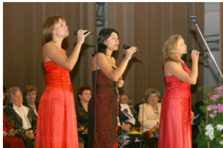
Співають «Солов'ї Галичини»

від дня заснування колектив обласної лікарні нагороджений Почесною грамотою Кабінету Міністрів України. Нагороду й вітання від Прем'єр-міністра країни Юлії Тимошенко вручив народний депутат Василь Деревляний. Привітання міністра охорони здоров'я Василя Князевича зачитав начальник управління охорони здоров'я Тер-