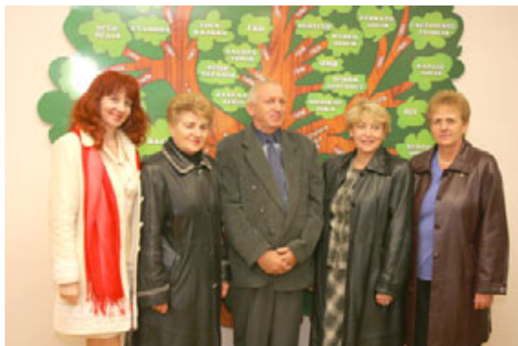
Біля генеалогічного древа лікарні

го наркозу раніше застосовували трубки багаторазового використання, вони також в експозиції музею. Гофровані шланги, гумові трубки, маски промивали, просували й ви-