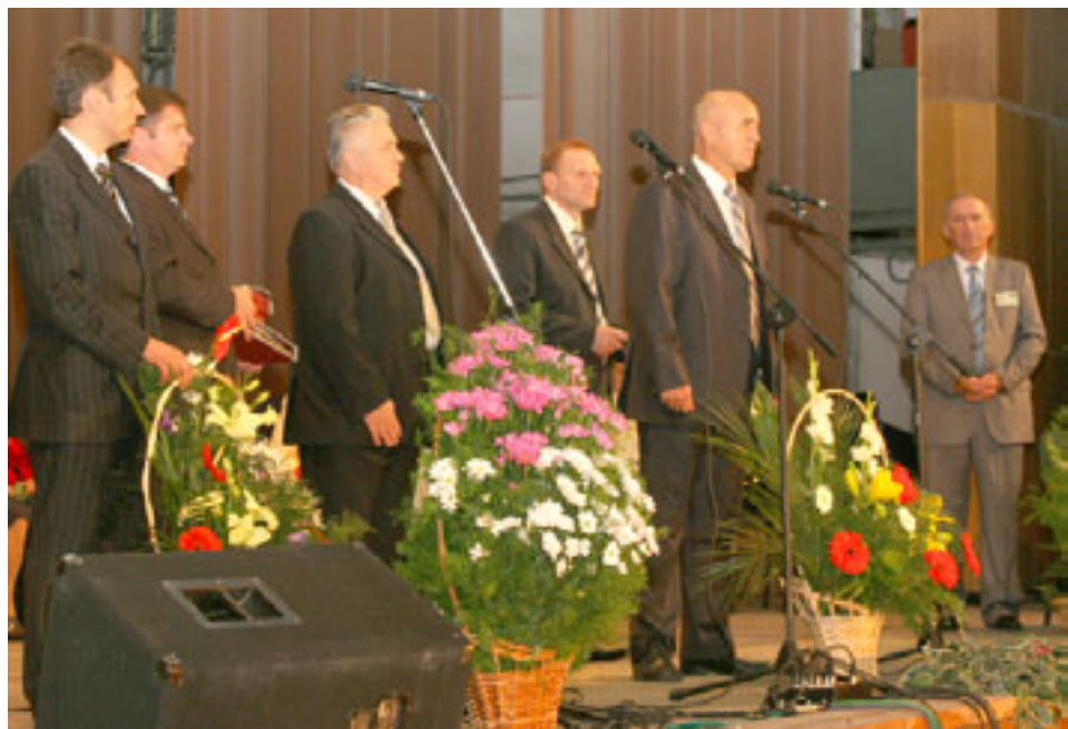
Колектив обласної комунальної клінічної лікарні з 50-річчям вітає ректор ТДМУ, професор Леонід КОВАЛЬЧУК та проректори медуніверситету

Минулого тижня цей найпотужніший медичний заклад нашого краю відзначив свій ювілей. Півстоліття – солідний вік для лікарні, яка всі ці роки невпинно розбудовувалася, розвивалася і зараз має не лише досягнення та добру репутацію, а й славні традиції.