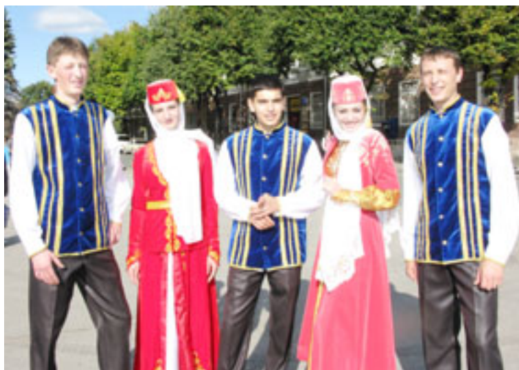
Учасники ансамблю «Бельбек» (м. Бахчисарай) здобули гран-прі фестивалю