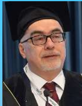
Serhat Bor професор Клініки гастроентерології медичного факультету Егейського університету, Ізмір, Туреччина. Президент Турецької гастроентерологічної асоціації (Turkey)