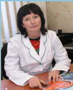
Галина Дмитрівна Фадєєнко

д-р мед. н., професор, директор Національного музею медицини України, завідувач кафедри внутрішньої медицини 1 Національного Медичного Університету ім. О.О. Богомольця, Заслужений лікар України (Київ)