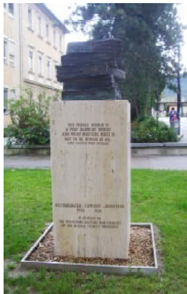
Пам'ятник викладачам і науковцям медичного університету Інсбрука, які загинули від рук нацистів 1938–1945 рр.

Наприкінці ХХ ст. людство усвідомило, що досягнути справжнього прогресу без високої моралі, моральних норм і правил неможливо. Вони конче потрібні не лише для того, щоб захистити кожного окремого індивідуума – хворого чи здорового, дитину чи людину похи-