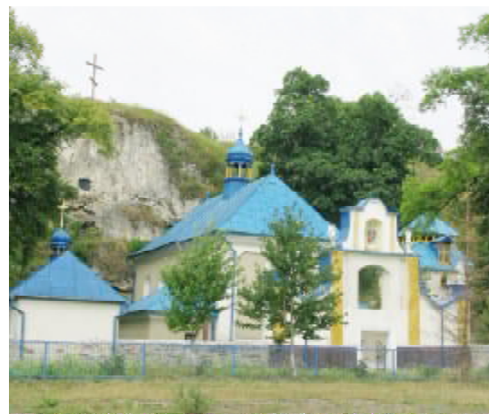
Церква св. преподобного Онуфрія у Рукоміші