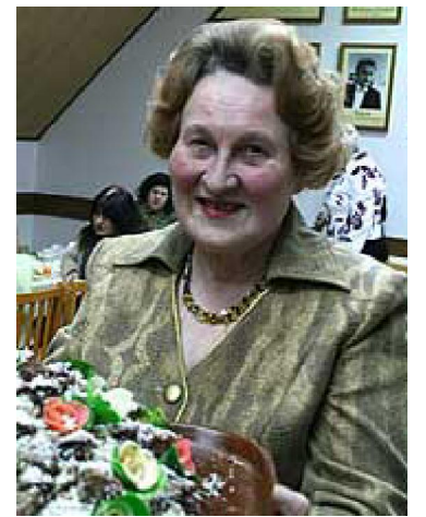
На довгих стежках Вашої ниви Будьте завжди здорові й щасливі!

Бажаю миру і світлої долі, Запалу, енергії, сили доволі. Творчої ватри, віри й наснаги, Щедрості серця, людської поваги.