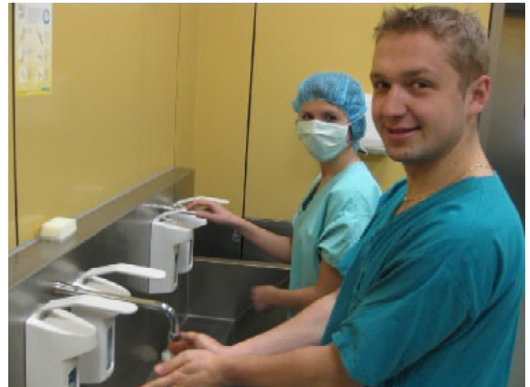
Готуються до операції

Загалом нас вразили масштаби лікарні. Надзвичайно приємно й легко було спілкуватися з лікарями, які з радістю пояснювали хід усіх операцій та давали