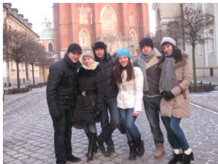
Під час екскурсії Вроцлавом