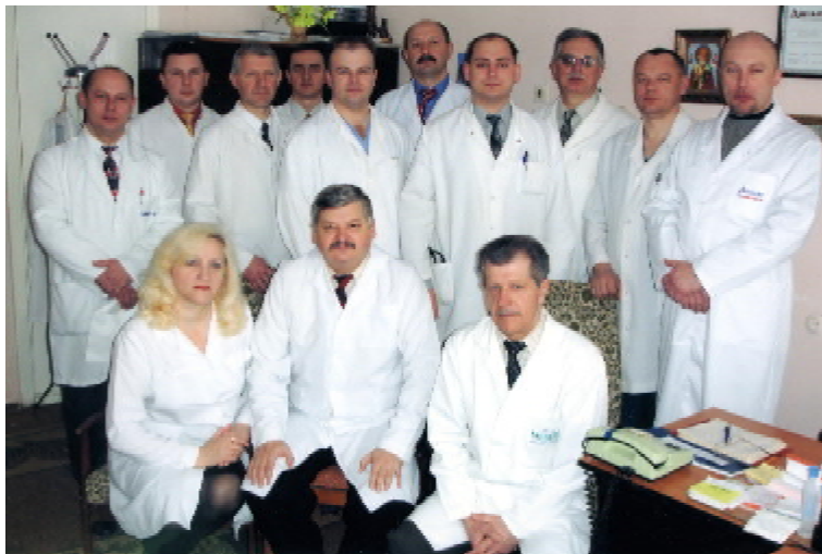
Колектив кафедри хірургії ФПО

реперфузійного синдрому у хворих з механічною жовтяницею, спосіб лікування ентеральної недостатності при перитоніті, методика прогнозування розвитку гострого післяопераційного панкреатиту, спосіб лікування некротичного панкреатиту, алгоритм вибору хірургічної тактики із застосуванням малоінвазивних технологій у хворих на хронічний калькульозний холецистит, критерії діагностики та алгоритм вибору хірургічної тактики з застосуванням малоінвазивних технологій у хворих на гострий деструктивний панкреатит, алгоритм вибору типу синтетичних алотрансплантатів у лікуванні складних гриж передньої черевної стінки, методи діагностики та лікування динамічної післяопераційної непрохідності кишки, техніка виконання лапароскопічної холецистектомії, нові способи зупинки кровотечі з ложа жовчного міхура під час лапароскопічної холецистектомії, запобігання випадінню конкрементів із жовчного міхура крізь ятрогенний перфоративний отвір під час лапароскопічної холецистектомії, дренивання черевної порожнини при лапароскопічній холецистектомії, (Закінчення на стор. 5)