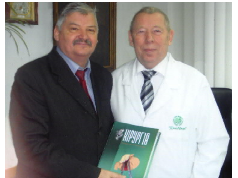
Зустріч з головним хірургом держави — академіком НАМН України, професором П.Д. ФОМІНИМ

Упродовж останніх п'яти років на кафедрі впроваджено сучасні методи діагностики та лікування хірургічних захворювань органів черевної порожнини: корекція