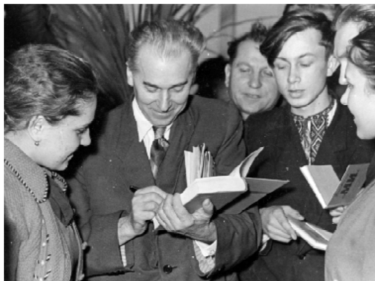
За автографом до живого класика (поет Павло Тичина у Тернопільському медінституті, 1960 р.)

історії КПРС на першому курсі та завершуючи науковим комунізмом на шостому. Це не вважали дивиною, бо випускники всіх тодішніх медичних інститутів повинні були стати не просто лікарями, а радянськими лікарями, тобто, не лише такими, які могли б ефективно лікувати хвороби, але й пропагувати в народі «геніальні та єдино правильні» марксистсько-ленінські ідеї вкупі з войовничим антирелігійним матеріалізмом та не просто здоровий спосіб життя, а такий, який теж називався радянським. Про це мовили на кожній лекції чи практичному занятті, висвітлювали на сторінках стінних газет кожного курсу (до речі, загальноінститутська стінна газета називалася «За радянського лікаря») та у виступах художньої самодіяльності.