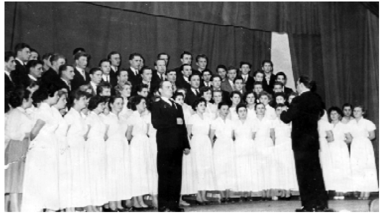
Інститутський хор (1960 р.)

Ті, хто не мав належної матеріальної підтримки від батьків чи рідних, намагалися підробляти в лікарнях, на посадах середнього медперсоналу або змушені