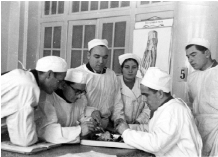
На практичному занятті з анатомії людини, 1 курс (1957 р.)

Звістку про заснування в Тернополі медичного інституту зустріли з радістю та надією на можливість навчання в ньому не тільки ті, хто мріяв стати лікарем, а й вся громадськість краю. Адже тоді вищий навчальний заклад у нашій області представляв лише Кременецький педагогічний інститут. Це певним чином дискредитувало обласний центр, у якому після закінчення школи можна було навчатися хіба у кооперативному технікумі. Тож керівники області та міста були особливо наполегливими у тому, щоб запланований в столиці новий та ще й конче потрібний виснаженому війною і післяво-