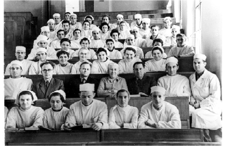
Актив 3 курсу з колективом кафедри мікробіології (28 грудня 1959 р.)

навіть весілля ґрунтувалося на взаємній любові, свідченням чого є хоча б те, що «освячена» тоді сімейна пара десяти років прожила у добрі та згоді.