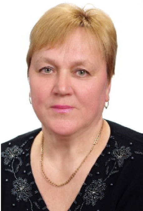
Ректорат ТДМУ імені І.Я. Горбачевського