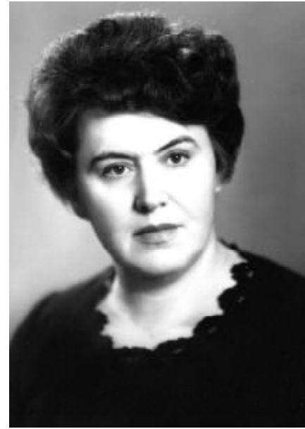
Ви не тільки частицу науки – Увезли Ви і наши сердца, Увезли Ви і боль в день разлуки.

Я хочу напоследок сказать, Чтобы помнили Вы наставленья, Чтоб незнанье и тьму побеждать Надо знанье, чуткость, уменья.