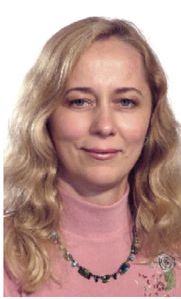
Ректорат ТДМУ імені І.Я. Горбачевського

Колектив університету глибоко поважає й щиро шанує Вас як відомого науковця, висококваліфікованого клініциста-педіатра, досвідченого педагога та