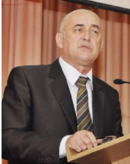
Леонід КОВАЛЬЧУК, ректор ТДМУ, член-кореспондент НАМН України, професор

Понад 250 представників з різних куточків країни та зарубіжжя зібрав форум. Відкрив конференцію та привітав її учасників ректор Тернопільського медичного університету ім. І. Горбачевського, член-кореспондент НАМН України, професор Леонід Ковальчук