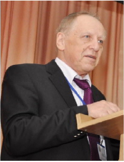
Озар МІНЦЕР, завідувач кафедри медичної інформатики Національної медичної академії післядипломної освіти імені П.Л. Шупика, професор

Зацікавлено слухали присутні й доповідь ректора ТДМУ, члена-кореспондента НАМН України, професора Леоніда Ковальчука, присвячену питанням прогнозування