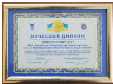
Вітаємо колектив з почесною відзнакою!

Диплом підписав президент Торгово-промислової палати України С. Скрипченко та голова МГО «Міжнародний комітет захисту прав людини» І. Данілов.