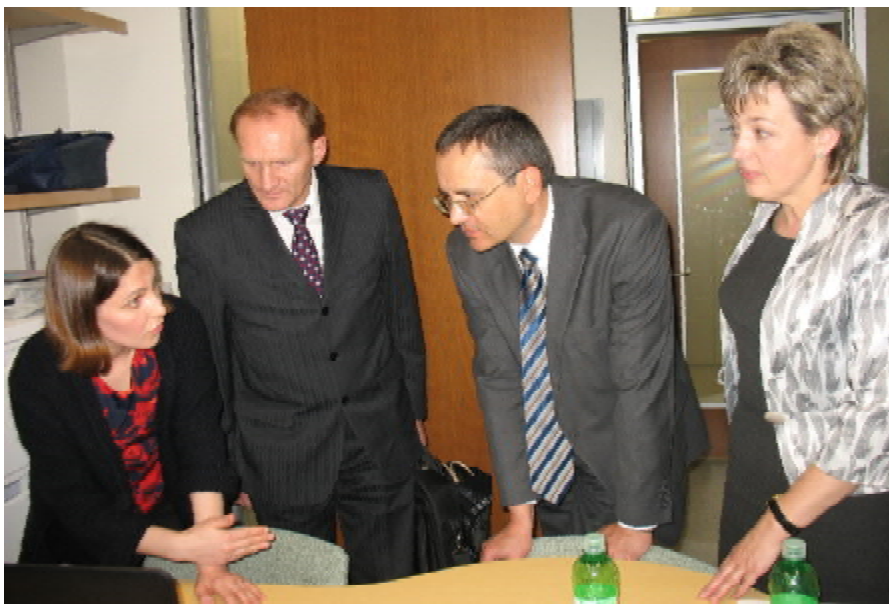
Демонстрація програми досліджень обструктивних захворювань органів дихання у дітей

Після зустрічі в коледжі медсестринства члени української делегації ознайомилися з роботою та організацією навчального процесу Канадського центру здоров'я та безпеки в сільському господарстві університету Саскачеваня. Центр бере участь у міжнародній програмі з епідеміологічних досліджень захворювань органів дихання у дітей. У цій програмі, крім канадського центру, беруть також участь науковці з Сілезької медичної академії (Катовіце) та Тернопільського державного медичного університету (кафедра педіатрії № 1).