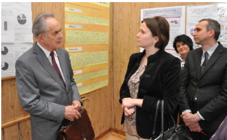
Член-кореспондент НАМН України, професор Михайло АНДРЕЙЧИН (ліворуч) під час конференції

онкологія, травматологія», «Стоматологія, оториноларингологія, офтальмологія», «Охорона материнства та дитинства» з підсекціями «Акушерство та гінекологія» і «Педіатрія», «Експериментальна медицина, морфологія у нормі, при патології, клініко-лабораторна та інструментальна діагностика, пошук, розробка та доклінічне вивчення нових лікарських препаратів та субстанцій», «Соціальна медицина,