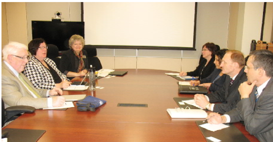
Зустріч української делегації з викладачами коледжу медсестринства університету Саскачеваня

Увечері 6 травня українська делегація взяла участь у щорічному засіданні-банкеті Українського фонду підтримки освіти (UFCE). Це – добродійний вечір, на якому були присутні 210 осіб, у тому числі міністри уряду провінції Альберта, президент університету Мак-Ювена, єпископи греко-католицької та православної церков провінції Альберта, відомі меценати й бізнесмени, професори університету Альберта та університету Мак-Ювена, українська діаспора. З вітальним словом виступили президент університету Мак-Ювена, др. Д. Аткинсон