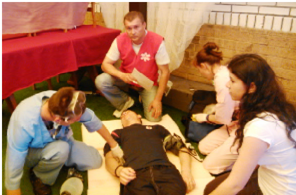
Виконання конкурсного завдання «Сюрприз»

Водночас, аби підвищувати рівень їх теоретичної підготовки та практичних навичок, на Тернопіль традиційно проводять змагання бригад ШМД. Цьогоріч