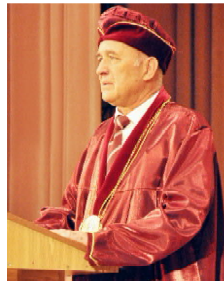
(Продовження на стор. 4)