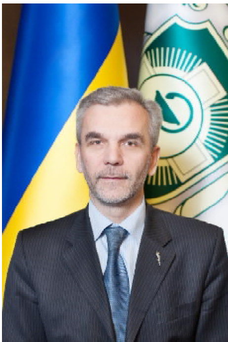
Шановні першокурсники, викладачі та студенти вищих медичних і фармацевтичних навчальних закладів України!