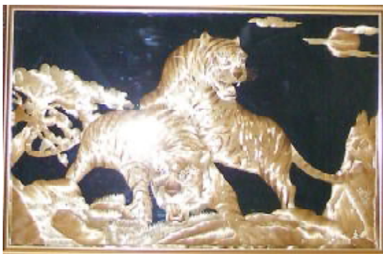
Творчі роботи Петра ЛЕВИЦЬКОГО