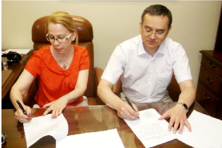
Підписання угоди між ТДМУ та компанією «Global Professional Consulting»

Дистанційну форму навчання у ТДМУ здійснюють вже протягом