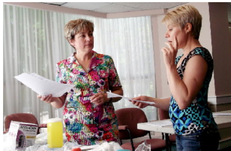
Практична частина державного іспиту (м. Торонто, Канада)

Кількість студентів-дистанційників ТДМУ постійно зростає: 2010 р. – 44, 2011 р. – 160, 2012 р. – 247, 2013 р. – 361, 2014 р. – 425, 2015 р. – 470 студентів. Цього року в ННІ медсестринства за дистанційною програмою навчання випускають 177 бакалаврів (з них – 130 іноземців) та 54 магістри (з них – 15 іноземців).