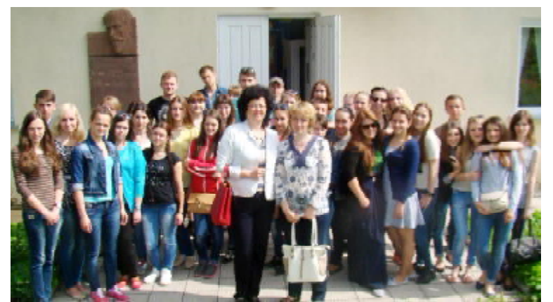
У садибі-музеї Івана Горбачевського у с. Зарубинці

Цього ж дня мали нагоду також відвідати музей-садибу ро-