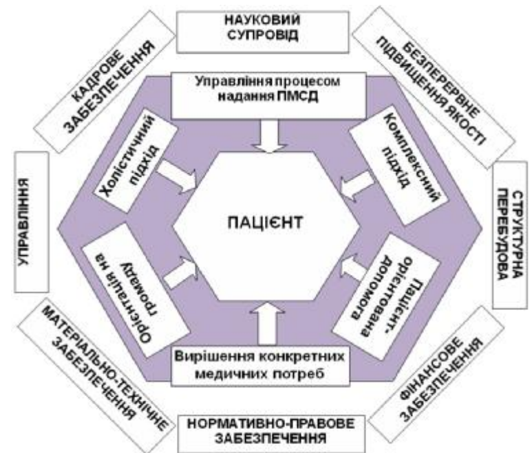
Схема. Структурно-функціональна модель ПМСД на засадах сімейної медицини