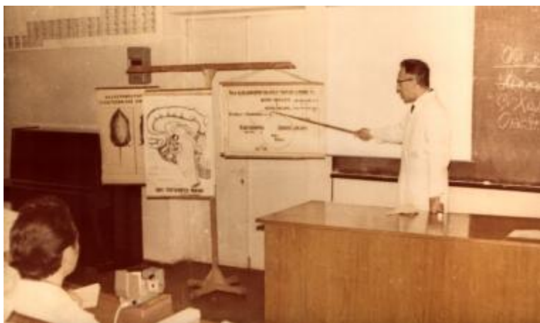
Проф. Е.Н. Бергер читає лекцію студентам III курсу Тернопільського медінституту (1972 рік)

У серпні 1941 року у зв'язку з нападом гітлерівської Німеччини на СРСР Інститут експериментальної медицини згорнув свою роботу і його співробітників, у тому числі й Е.Н. Бергера, звільнили з посад. У вересні 1941 року Е.Н. Бергер разом з Харківським медичним інститутом евакуювався в м. Чкалов (тепер — Оренбург), де продовжував працювати асистентом кафедри патологічної фізіології. Одночасно він читав курс військово-медичної підготовки у Чкаловському ветеринарно-зоотехнічному інституті та викладав патологію й військову гігієну в місцевому медичному училищі. 1944 року Е.Н. Бергер разом з медичним інститутом реєвакуювався до Харкова та був затверджений на доцентську посаду. 1947 року