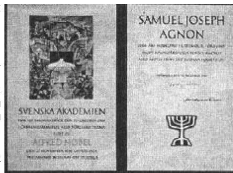
Нобелівські диплом Ш.-Й. Агнона

Нині Агнон належить до найвидатніших письменників ХХ століття, його ім'я стоїть поряд з іменами Джеймса Джойса, Марселя Пруста, Вільяма Фолкнера та Франца Кафки. Твори письменника перекладені багатьма мовами світу, в тому числі й українською.