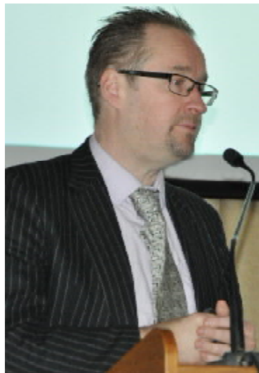
Магнус УНЕМО, професор (Швеція)

Понад 200 учасників-науковців та фахівців практичної медицини з Києва, Харкова, Дніпропетровська, Рівного, Ужгорода, Вінниці, Тернополя та інших міст збрала науково-практична конференція «Менеджмент надання спеціалізованої медичної допомоги при інфекціях, які передаються статевим шляхом», що відбулася у ТДМУ. У цьому заході взяли участь заслужений лікар України, головний дерматовенеролог МОЗ України, прези-