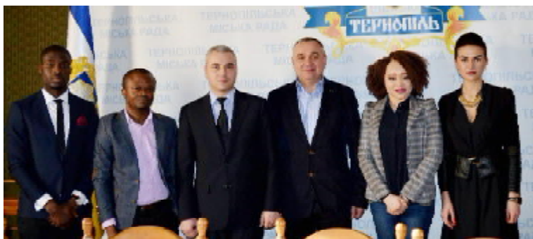
Під час зустрічі в міській раді