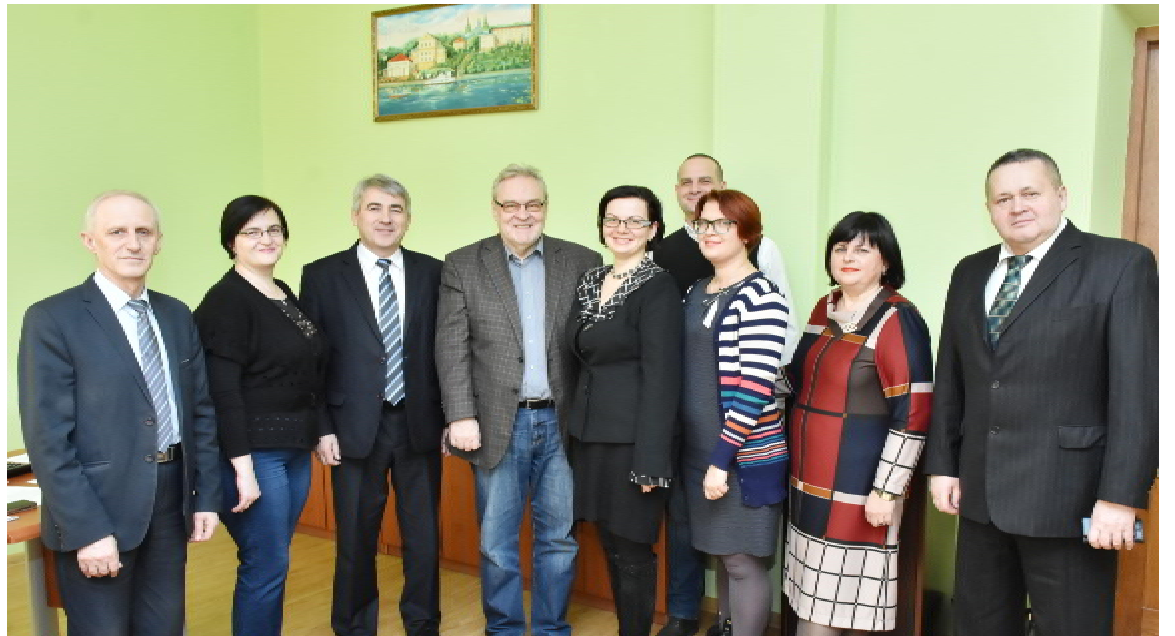
Під час перебування з робочим візитом у ТДМУ голови наукової ради Інституту медицини села, професора Альфреда ОВОЦА (Польща)

Одразу після семінару впродовж двох днів делегація Тернопільського державного медичного університету імені І.Горбачевського у складі завідувача кафедри фізичної реабілітації, здоров'я людини та фізичного