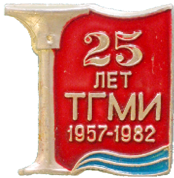
Значок до 25-річчя інституту

Заготовки було зроблено у необхідній кількості, але в умовах цейтноту та ще й кустарним способом вдалося більш-менш якісно хромувати майже 800 штук. Для цього автору цієї публікації