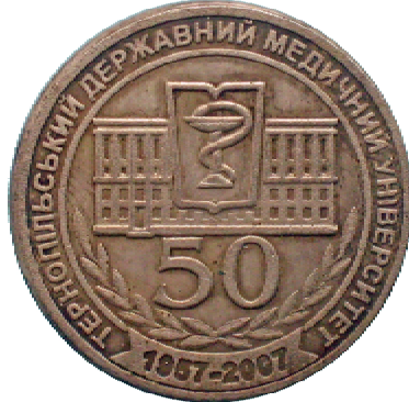
Значок до 50-річчя університету

Рисунок медалі медичного факультету нагадує герб університету, але на синій стрічці інший текст: «Медичний факультет ТДМУ ім. І.Я. Горбачевського». Поле картуша – жовте. В центрі його – розгорнута книга біло-