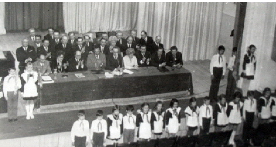
Урочисте засідання, присвячене 20-річчю інституту (11 квітня 1977 року)

До ювілею було видано книжку під назвою «Десять років Тернопільського державного медичного інституту. (1957-1967)». Видання розпочинається ґрунтов-