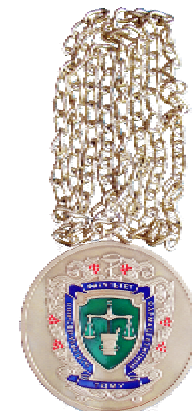
Медаль фармацевтичного факультету

го кольору, на її тлі – мікроскоп. Виготовлено п'ять екземплярів медалі: один – для декана медичного факультету та чотири – для директорів ННІ, які