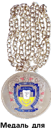
Медаль для проректорів

(тоді – заступникові декана) довелося буквально напередодні урочин звільнити із занять 16 студентів і відвезти їх інститутським автобусом до старих приміщень «Ватри», що на вул. Заводській (тепер – вул. Бродівська), де вони вручну нанизували заготовки на дроти, після чого їх хромували у звичайних відрах. Відібрані екземпляри покрили лаком у будинку побуту «Пенза» (тепер – «Роксолана»). Символ значка – випукло виконаний стетоскоп. Праворуч – напис у чотири рядки «25 лет ТГМИ 1957-1982» на тлі стилізованого червоно-лазового прапора УРСР.