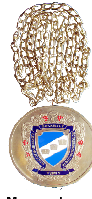
Медаль факультету післядипломної освіти