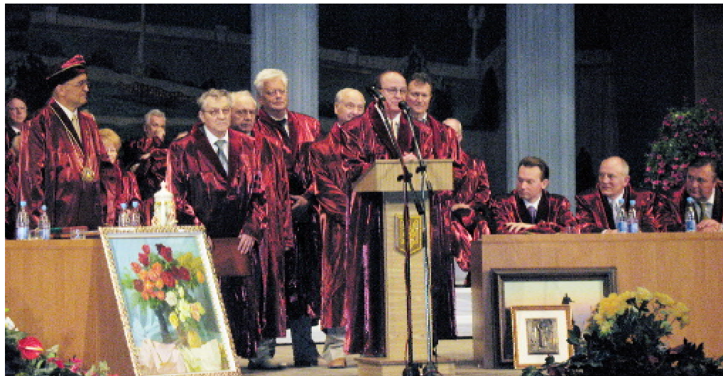
ТДМУ відзначає 50-річчя. Від іноземних гостей виступає Томаш Зіма, декан першого медичного факультету Карлового університету, Чехія (2007 рік)

Від імені ректорів медичних ВНЗ України з вітанням виступив