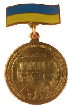
Значок до 55-річчя університету

Пам'ятна медаль являє собою латунний круг, в центрі лицевої сторони його – герб університету з розфарбованими елементами картуша. Вгорі, на стрічці з двома симетричними згинами стоять дати: «1957-2007». Внизу – дві перехрещені лаврові гілки, які обрамлюють нижню половину герба. Центральну частину зворотної сторони займає адміністративний корпус. По колу текст «Тернопільський державний медичний університет ім. І.Я. Горбачевського», внизу – «50 років». Кількість виготовлених екземплярів – 100.