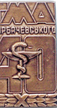
Значок до 40-річчя академії