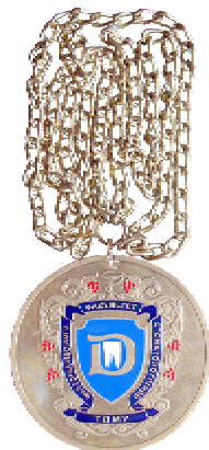
Медаль стоматологічного факультету