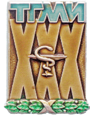
Значок до 30-річчя інституту

Заготовки було зроблено у необхідній кількості, але в умовах цейтноту та ще й кустарним способом вдалося більш-менш якісно хромувати майже 800 штук. Для цього автору цієї публікації