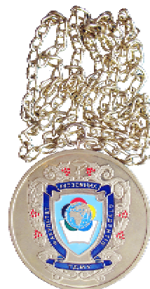
Медаль факультету іноземних студентів