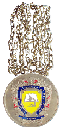
Медаль медичного факультету

медалі трьох різновидів – ректорську, велику та пам'ятну. Перші дві носять на шиї на ланцюжках під час урочистих засідань вченої ради або святкових