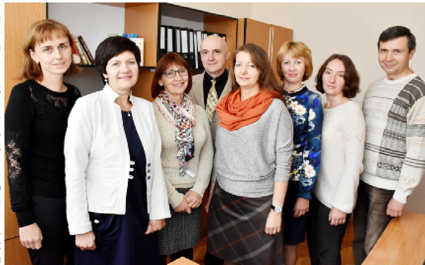
Колектив кафедри української мови (2016 р.)