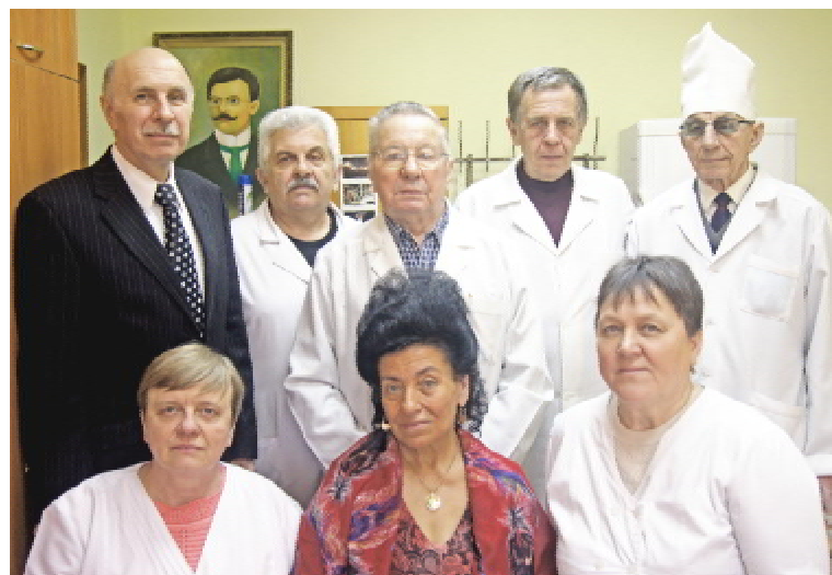
Колектив кафедри онкології, променевої діагностики і терапії та радіаційної медицини ТДМУ

Ситуацію щодо захворюваності на рак жіночих статевих органів