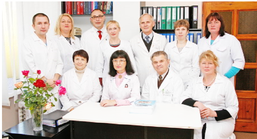
Колектив кафедри (2015 р.)

хом, на мою думку, додало нам усім рішучості, сміливості, швидкості прийняття важливих рішень. Я б навіть сказала, що це додало удачі, якоїсь динамічності та оптимізму.