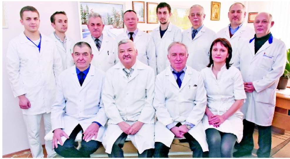
Колектив кафедри хірургії науково-навчального інституту післядипломної освіти