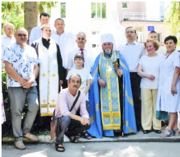
Під час відкриття та освячення пам'ятника Св. Рогу (2019 р.)

– Журнал – це такий наш маленький подвиг. Це перший журнал з інфекційних хвороб в Україні й перший часопис, який почав випускати наш університет. Він виходить щоквартально з 95-го року, два номери залишилося до сотні. Жодного разу ми не зірвали вихід, не було перерви й здвоєння номерів. Тут публікуються статті провідних інфекціоністів України та з-за кордону. Журнал виходить двома мовами – українською та англійською, за що я, до речі, мав клопіт свого часу в Києві з деякими колегами, які твердили: