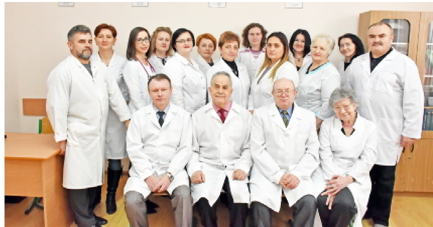
Академік Михайло АНДРЕЙЧИН зі співробітниками кафедри інфекційних хвороб з епідеміологією, шкірними та венеричними хворобами (2017 р.)

За допомогою керівництва університету вдалося створити потужний науковий колектив, який понад чотири роки досліджує хворобу Лайма та інші інфекції, що передають кліщі. Таких поглиблених масштабних досліджень в Україні ніхто не проводив. Якщо до нас визначали два або, щонайбільше, три види збудника інфекційних хвороб, то ми визначаємо вже таких вісім, що переносять кліщі. Ми поглибили уявлення про епідеміологію цих захворювань на Тернопільщині та в інших регіонах. Вдалося дослідити поширення цієї інфекції в семи областях України, обстежити тут групу ризику, а саме — працівників лісових господарств, виявити в них ці інфекційні захворювання й, відповідно, запропонувати лікування. Ми навели достатньо доказів, аби хвороби, які передаються кліщами, віднести до професійних захворювань лісників і деяких інших груп населення. (Продовження на стор. 8)