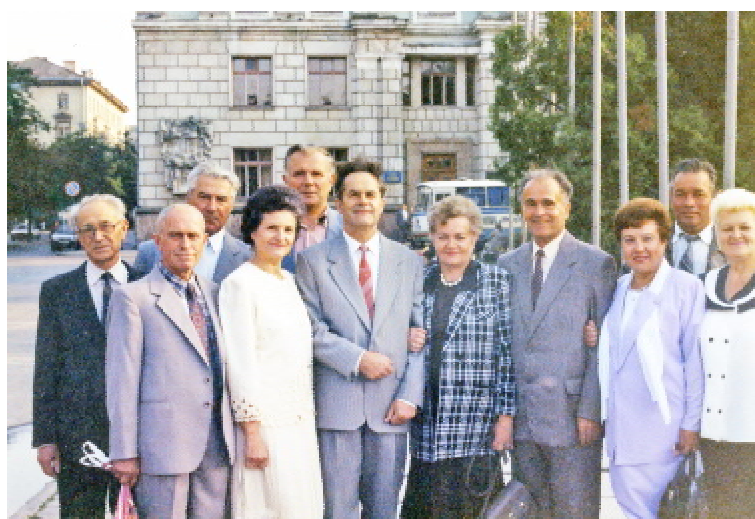
З однокурсниками (1997 р.)