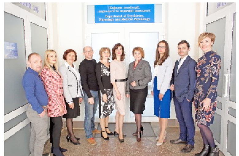
Колектив кафедри психіатрії, наркології та медичної психології ТНМУ

стало знаковою подією для її працівників і студентів, адже нині вона, без перебільшення, створена за європейським зразком. — Упродовж багатьох десятиліть навчальна база кафедри була далека від ідеального стандарту, перебуваючи на віддалених площах у різних відділеннях, де поруч з облаштованими за