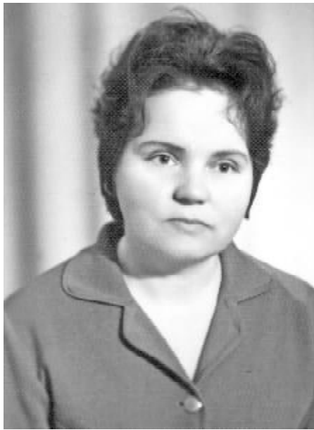
Ваша професійна та громадська діяльність відзначені медаллю «Ветеран праці», подяками адміністрації університету.

Ректорат, профком і весь колектив університету глибоко поважають та щиро шанують Вас за багаторічну невтомну працю, високий професіоналізм, сумлінне виконання своїх службових і громадських обов'язків.