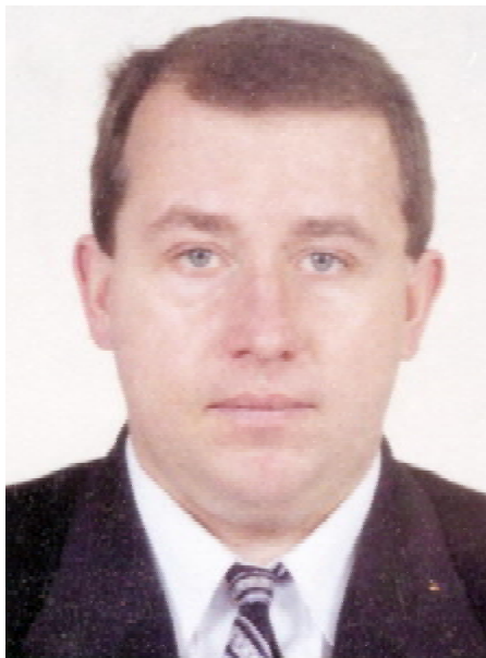
цювати з людьми, сумлінне виконання своїх службових і громадських обов'язків.

Ректорат, профком та увесь колектив університету глибоко поважають і щиро шанують Вас за багаторічну невтомну працю і високий професіоналізм. Особливо цінуємо Ваш досвід, організаторський талант, вміння пра-