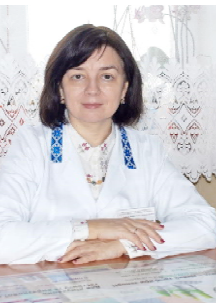
комісії відділу незалежного тестування знань студентів.

Активною є Ваша громадська діяльність, зокрема, як кураторки студентських груп, відповідальної за лікувальну роботу кафедри, членкині екзаменаційної