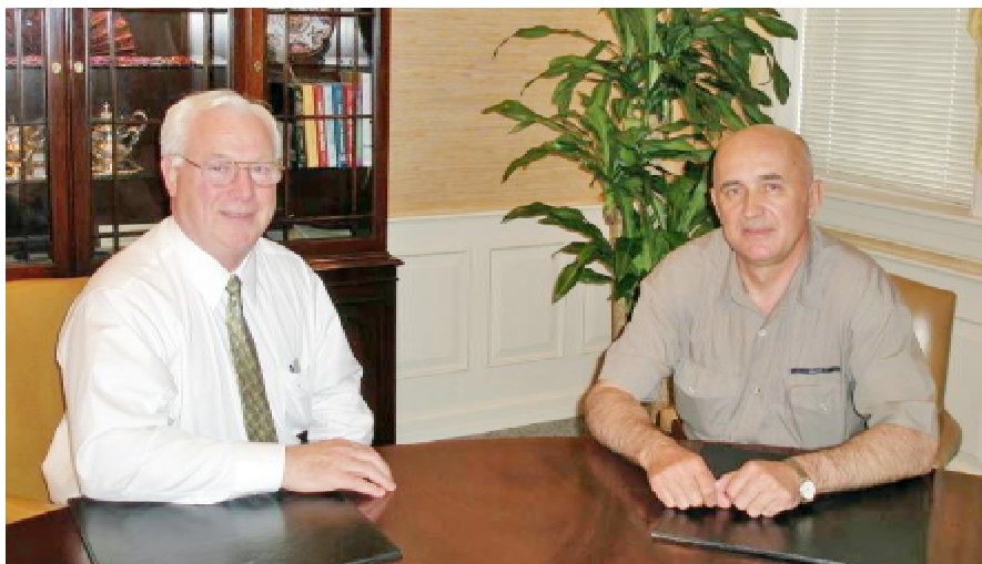
Білл Дж. КОЛЕМАН під час зустрічі з ректором Тернопільського медуніверситету, членом-кореспондентом НАМН України, професором Леонідом КОВАЛЬЧУКОМ (2005 р.)

Я побачив двох літніх пань, які сиділи в кріслах за столом з книгами записів перед ними. Почав розмовляти з ними англійською, отримав кілька приємних посмішок. За якусь хвилину-другу мені відрекомендували молоду жінку, яка говорила не дуже доброю англійською, але цілком достатнього рівня. Вона сказала, що служить у церкві як перекладач. І розповіла, що в Тернополі реставрують чотири церкви, й ще три будують».