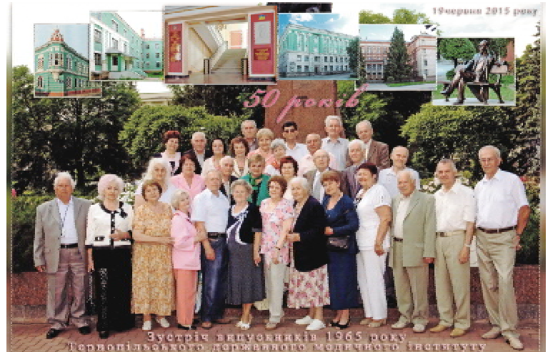
Зустріч через пів століття

Дай Бог здоров'я і добра Й ще довгих літ прожити, Щоб внуків, правнуків своїх До серця притулити.