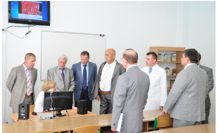
Демонстрація можливостей дистанційної інтраопераційної експрес-діагностики на нараді ректорів (2012 р.)

дослідження ДНК, генетичні висліди, а це потребує високотехнологічних морфологічних досліджень, оскільки виникла така потреба, то є сенс і в підготовці спеціалістів та високотехнологічних лабораторіях. А це, звісно ж, потребує фінансування. І хоча воно в наших вітчизняних клініках не достатнє, в Україні вже з'являються перші ластівки. Скажімо, в нашому університеті створили сучасну потужну морфологічну лабораторію. Варто висловити вдячність нашому ректору Михайлові Михайловичу Корді, за сприяння якого вона з'явилася. Пишаємося цією лабораторією, яка дає можливість провести дослідження швидко та на високому рівні. Наразі запроваджуємо складніші методи, як от імуногістохімічне дослідження. Сподіваємося на кращі часи та те, що й у клініках України будуть усі можливості для прове-