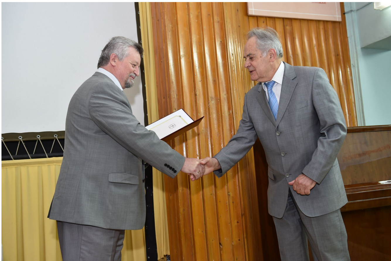
Президент НАМНУ В. І. Цимбалюк вручає диплом академіка М. А. Андрейчину

Список праць, знання іноземних мов, досвід експертної діяльності (наукове опонування, редагування, робота в експертних групах, спеціалізованих вчених радах), індекс Гірша.