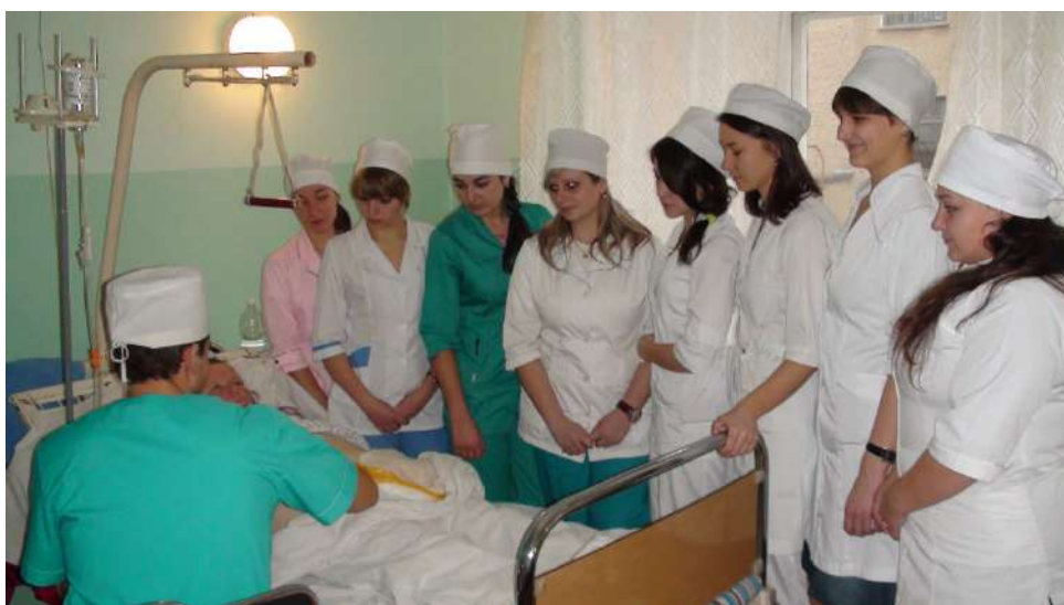
Курація хворого в палаті (2012 р)